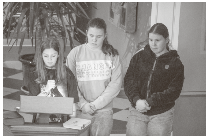
22. April 2023, Religionsschülerinnen am gemeinsamen Popularmusik-Gottesdienst in der Kirche Uesslingen